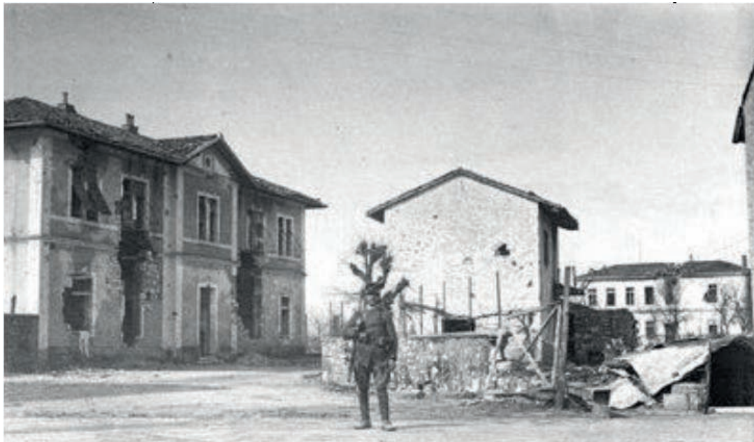
Soldato davanti al municipio e alla scuola dopo i bombardamenti dell'estate 1915